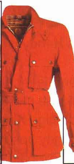
▲ Fescher Feuerwehrmann Parka von Belstaff (Amicis, Wien 1, Seilerstätte 24) und Krawatten von Ferragamo (1., Kohlmarkt 7).

▲ Hommage à Mozart Von Montblanc, vergoldet und mit Koralle veredelt, 765 Euro. ▶ Rote Mamba Gürtel von Baldessarini (ca. 180 Euro) mit passenden Sneakers. ▼