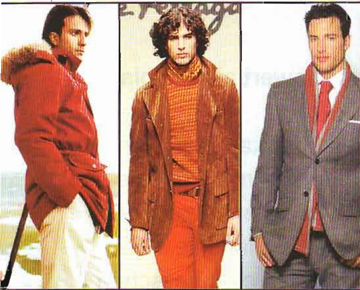
▲ Rotes Tuch Ermenegildo Zegna, Salvatore Ferragamo und René Lézard erhellen die Tage mit der feurigsten aller Farben.