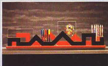
■ „Galaxy“ von Martina Lang stützt das Büro-Universum. Holz, colorlackiert um 355 Euro.