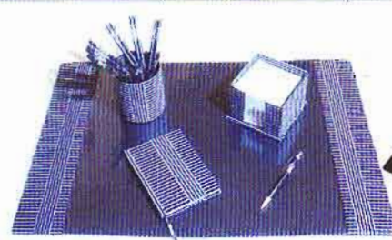
■ Klar & klassisch Josef Hoffmann für den Schreibtisch. Bei Backhausen ca. 112 Euro.

● Weihnachtungswünsche, Weihnachtsgrüße ... es muss fest geschrieben werden dieser Tage! Per e-Mail und SMS am flottes-ten, auf Büttenpapier und mit Füllfeder jedoch am schönsten. Am angenehmsten einstimmen lässt es sich in die Phase des Fabulierens und Formulierens, wenn man die entsprechende Entourage schafft. Etwa: Josef Hoffmann (klar strukturiert) als Unterlage für geschäftliche Weihnachtsworte, Gelacktes von Montblanc für Cocktail-, Golf- und Liebespartner (stark, sinnlich, selbstbewusst), Galaktisches von Lang als Basis für kreative Zeilen (so viele Gestaltungsmöglichkeiten!) und Flexibles von Horn (notfalls ein Reiseset) für den Cosmo.